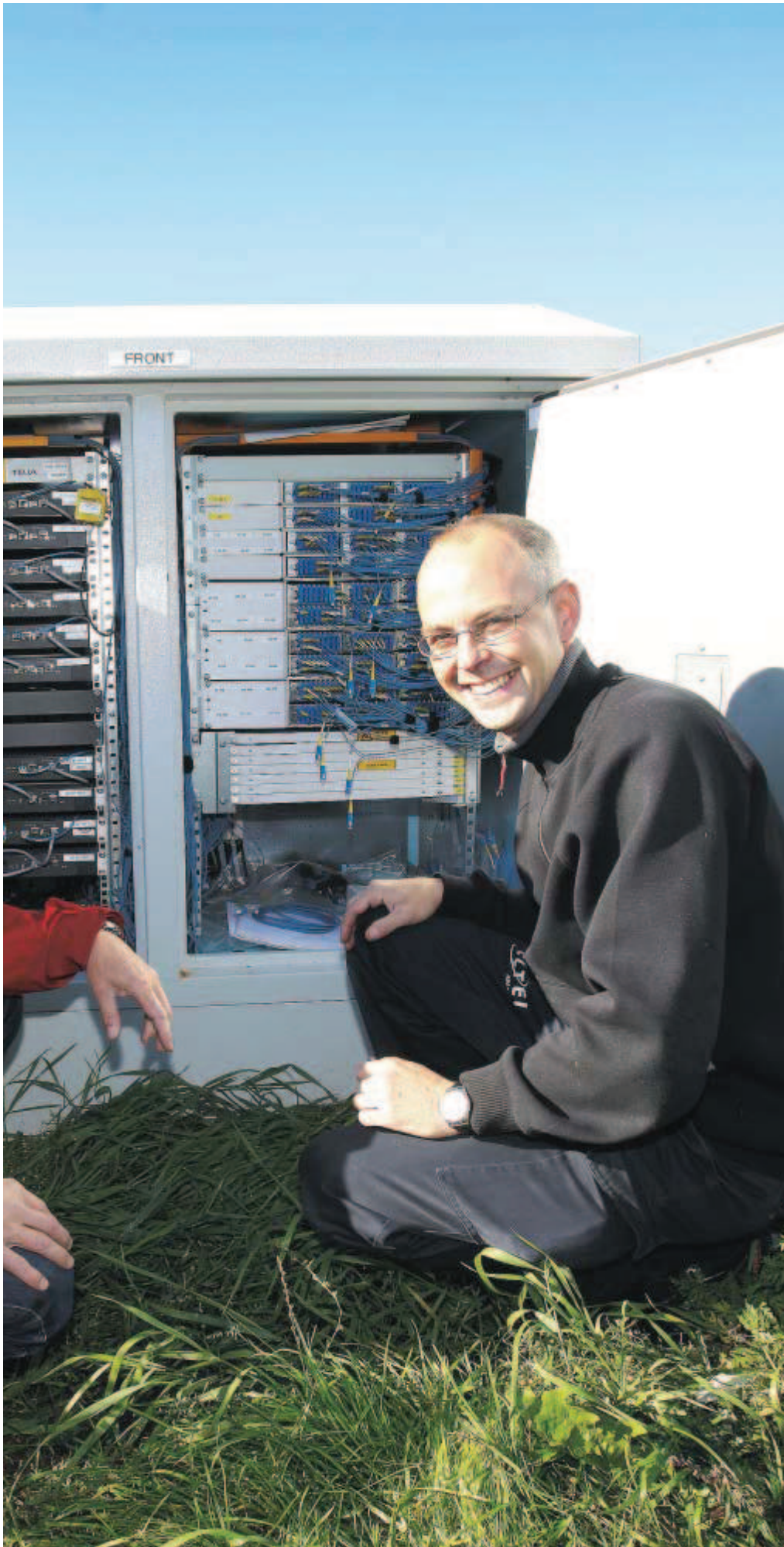
ip som kopplar upp 250 villor i Svartbjörnsbyn mot internet.