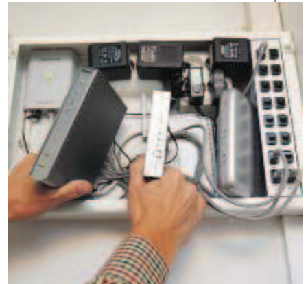
▲ Bredbandsskåpet i villan samlar bredbands- switchar för internet, telefon och tv.