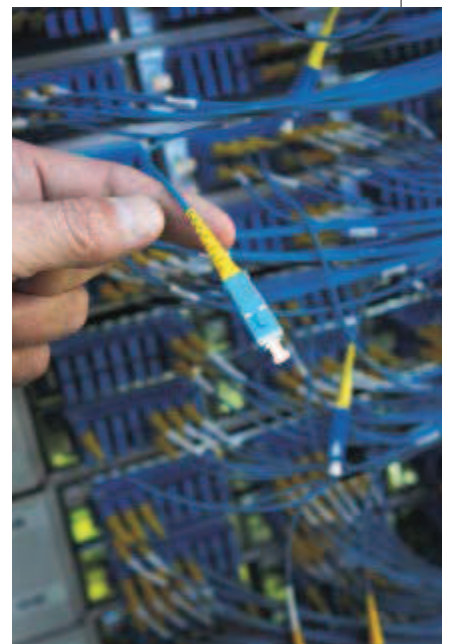
▲ En av alla 250 fiberanslutningar i teknikskåpet.